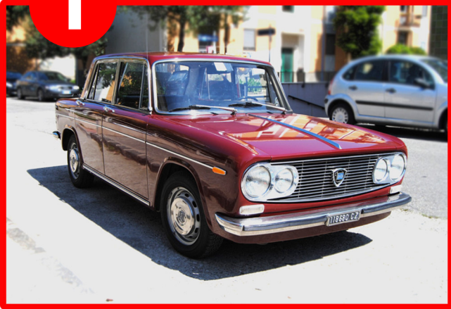
1 anteriore destra