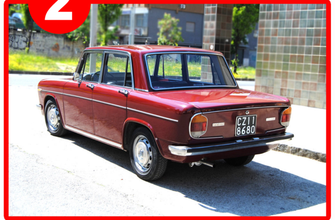
2 posteriore sinistra